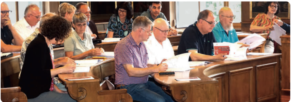
Die Jahresrechnung und der Rechenschaftsbericht 2025 wurden von den Ratsmitgliedern einstimmig genehmigt

Erfreulich rückläufig ist die Zahl der Kirchenglieder. «Schön zu sehen ist, dass die Kirchengliederzahl wieder unter das Niveau von 2022 gesunken