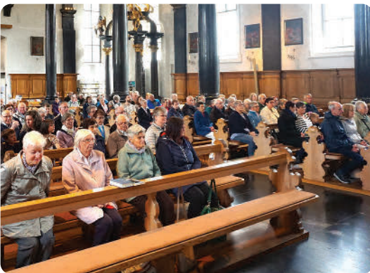
Mit Bahn, Bus und Auto sind sie gekommen, um für Kanton und Land und besonders für Frieden zu beten