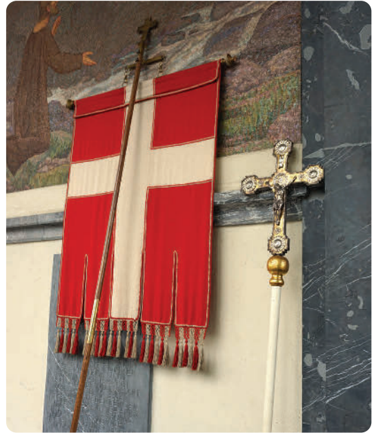
Zwei Symbole, die zu jeder Nidwaldner Wallfahrt dazugehören: Das Vortragskreuz mit dem Gekreuzigten und die Nidwaldnerfarben (rot/silber)