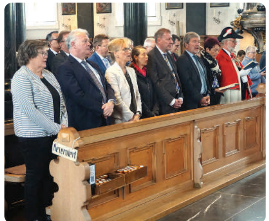
Die Nidwaldner Regierung war in corpore dabei, und mit ihr Vertretungen der Evangelisch-Reformierten und Römisch-Katholischen Kirche des Kantons