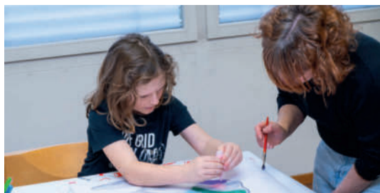
Bilder: Eltern-/ Kindmorgen Erstkommunion